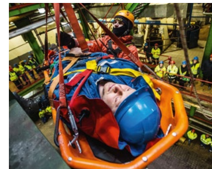
Journée sécurité à Tereos TTD (République tchèque)

Tereos place la santé-sécurité au cœur de sa stratégie et c'est d'ailleurs l'élément fédérateur de son plan de transformation global Ambitions 2022. L'objectif est de renforcer cette culture santé-sécurité à travers toutes les entités du Groupe pour partager les mêmes standards. Parmi les actions déployées, Tereos organise depuis deux ans une Journée Sécurité à l'échelle mondiale. C'est ainsi que le 20 mars 2019, toutes les entités du Groupe se sont mobilisées pour proposer des groupes de travail et divers ateliers pédagogiques sécurité autour d'un même slogan : « La sécurité, ça commence par moi ! ». Cela a permis de faire un bilan et de sensibiliser les équipes aux différents risques en lien avec leurs métiers. Au final, 50 sites participants et une centaine d'ateliers ou de formations spécifiques organisés pour l'occasion.